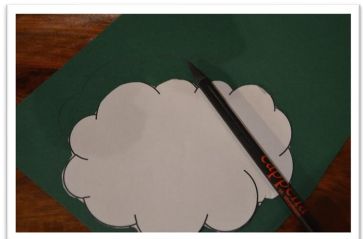
2. Baumkrone auf Tonkarton abmalen und ausschneiden