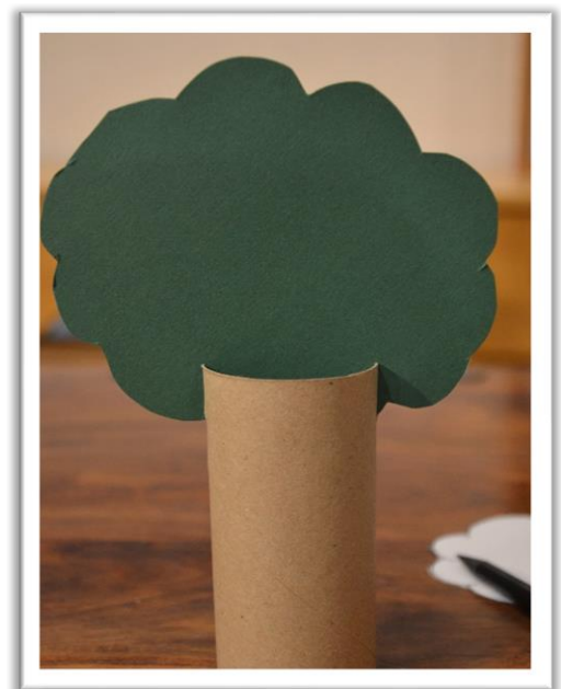
4. Baumkrone auf den Baumstamm setzen