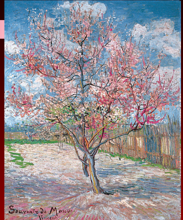
Vincent van Gogh, Blühender Pfirsichbaum